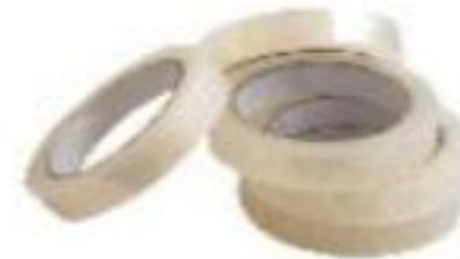
Un ruban adhésif